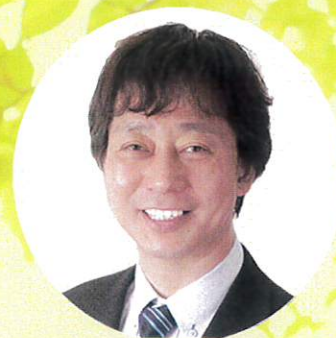
滋賀県よろず支援拠点 コーディネーター

愛荘町商工会 TEL 0749-42-2719 FAX 0749-42-5608 豊郷町商工会 TEL 0749-35-2022 FAX 0749-35-4522 甲良町商工会 TEL 0749-38-3530 FAX 0749-38-3977 多賀町商工会 TEL 0749-48-1811 FAX 0749-48-2188