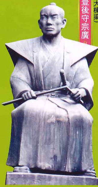
甲良の匠(大棟梁) 甲良豊後守宗廣