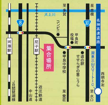
●集合場所アクセスマップ

彦愛犬地区商工会連絡協議会(担当:藤野・山口) 電話/0749-38-4011 FAX/0749-38-3977 Email/fujino_akira@shigasci.net 〒522-0244 犬上郡甲良町在士351番地4