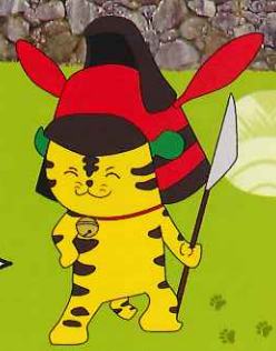
甲良町商工会の マスコットキャラクター とらにゃん

小さな町でも歴史文化豊かで 見どころいっぱい「甲良町」。 湖東の田園と東の鈴鹿山脈に春の芽吹きを 感じながら、お友達、ご家族、気の合う仲間 で一日ゆっくり歩いてみませんか。