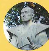
甲良豊後守宗廣公

(1296~1373) 足利尊氏の腹心 として活躍し、 文武に秀でた バサラ大名。