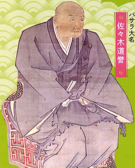
バサラ大名 佐々木道誉